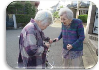
久々に公園に出かけました。