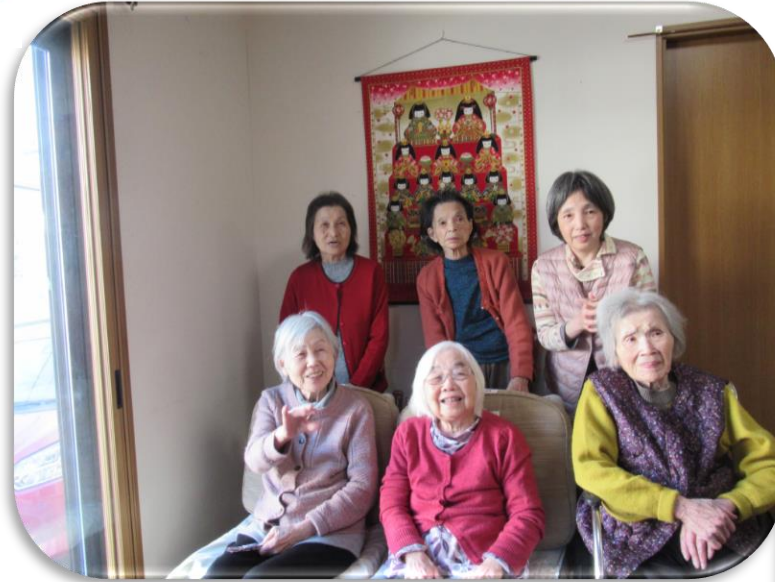
今日は楽しいひな祭り(^^♪

陽光の日差しに春を感じるようになり、ホームの皆さんも公園までの散歩に出かけたいと思います。ひな祭りは大好きなちらし寿司でお祝いしました。3月 日 さんのお誕生日にはお赤飯に懐石料理で楽しい夕食会でした。コロナは少し収まりかけたようですが、まだまだ油断しないで感染予防対策致します。連日報道されている戦争ニュース皆さんも怖いね、かわいそうにと心を痛めておられます。一日も早く平和な日が来ることを願います。