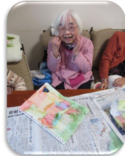
ちぎり紙できれいなコースターを作りました。