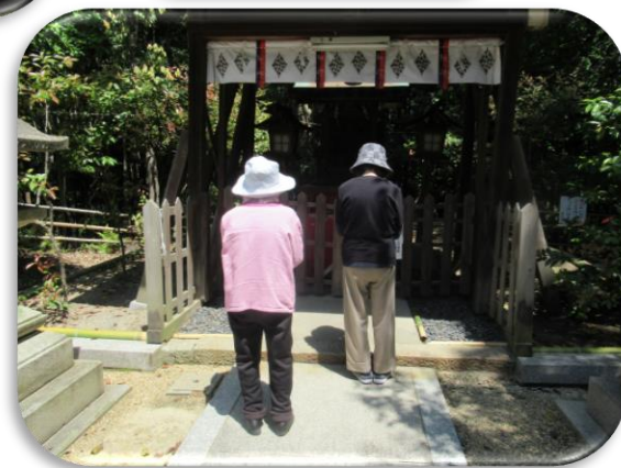
元気なお二人は春日神社まで散歩