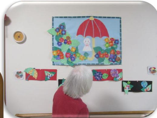
季節ごとの壁面飾りに時季の話や故郷の話などで盛り上がっています。

運営推進会議につきましては奇数月の第4月曜日を予定しております。次回は7月25日（月）予定です。