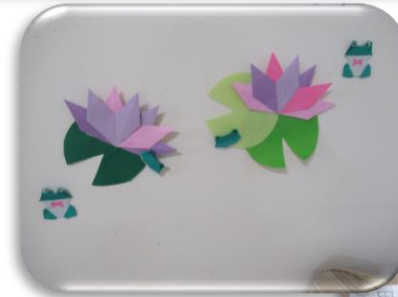
素敵な睡蓮ができました。