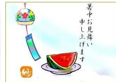
スタッフと一緒に絵手紙の作成