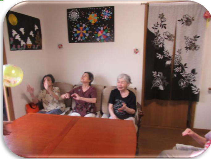
ボールが飛んで来ると皆さん自然と手が出ます。(^^)/