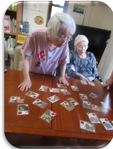
身を乗り出し絵札探し♪