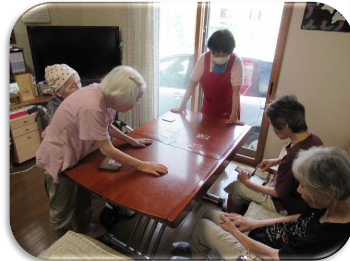
読み手もしっかりしてくれています。